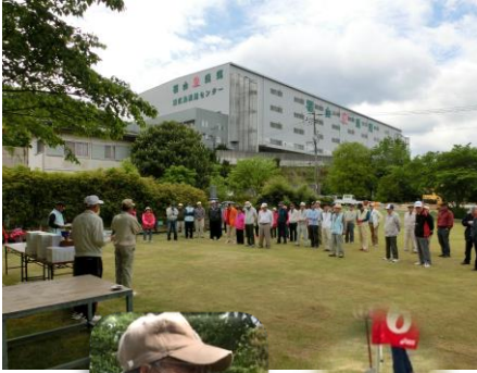
ホールインワン後 満面の笑み