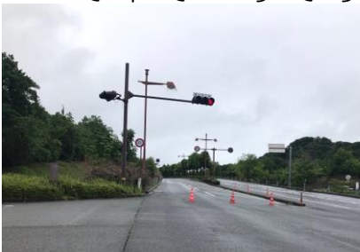
通行止めになった プールパール上り線 H30/7/7