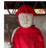
外国人に人気の 地藏菩薩 が蔓延したため、村民の苦し

西条町下見は中世には下見村と鴻巣村の二村に分かれていたそうで、この地藏堂も含め今も鴻巣の地名は残っています。 一六〇一年(慶長六年)の下見村検地によると、この時点では鴻巣村は下見村に合併しています(東広島市の歴史辞典より)。 清掃や管理は五の組が行っていますが、下見地区皆さんの地藏菩薩です。