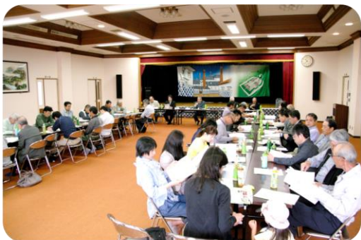
東広島市のシンボル酒蔵、なまこ壁、三ツ城古墳を表した幕をバックに、開催された総会

収入、支出も公明に承認され無事終了。今年度も行事が行われますが、それぞれの部会長が「多くの地区民に参加してほしい」などと挨拶。そして「今年度もよろしくお願い致します」と締めくくりました。