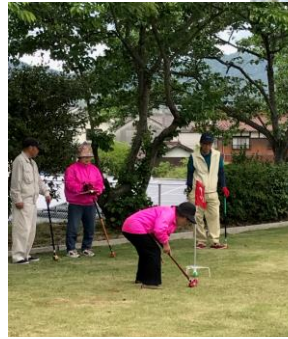
芝生の感触を楽しむ参加者

「グラウンドの方が歩きやすい」「打たんにゃあ飛ばんし、打ちゃあ飛ばんすぎるし・・・」「芝生はむつかしい」と。見物する人もプレーする人も、珍プレー好プレー