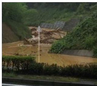
プールパールと下見街道から抜けた所 交差部分・右西条駅方面