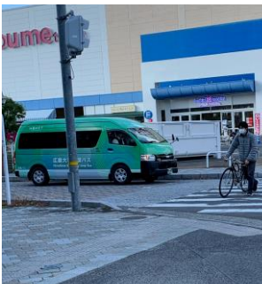
ゆめタウン学園店前を運行中の 広島大学循環バス

めタウン学園店など經由 する定時路線。デマンド運 行は時刻表はなく利用者 の要求に応じて予約し、バ ス停で待つ(大学周辺)と 言う事ようです。地区に 住む人の中には「新幹線 を利用するのに便利になる」 と言う人も。 交通関係も乗務員不足 など深刻な状況のようで、 地域のより利便性の高い 移動サービスを考えるの この試運転。運行継続の是 非はその後判断されます。 運行期間は、令和元年十 月〜令和二年一月、令和二 年四月〜令和二年七月ま で(予定)。問い合わせは 082-420-0917