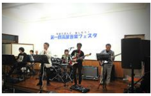
「高屋音楽フェスタ」出演者のひと組。選歴の頃練習を 始め、72歳を過ぎても頑張るバンドメンバー

東広島市は四七の自治 協議会で構成され、それぞ れ自治協ラーを出した イベントを行っています。 三ツ城自治協議会は、光 の宴。他の自治協議会では どんなイベントを行って いるのか覗いて見ました。