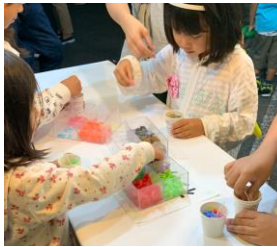
人気のちびっこ広場で キャンドルを作る子供たち