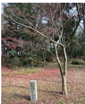
記念樹が植えられている 下見西側にある若宮神社