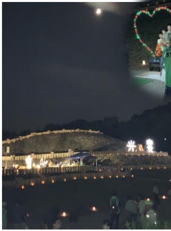
インスタ 映えする ところ