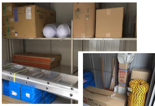
防災倉庫内の資機材

た時、どのようにして行へのか、日頃から避難場所、経路、かかる時間など確認しておきましょう。また、緊急時の連絡先なども普段からわかりやすいところに貼り、確認しておきましょう。