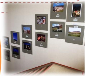
H28年度の 光の宴写真展示 下見福祉会館

今年度は八十作品の応募があり、東広島市内はもちろん、広島市や呉市からの応募も。そこに暮らす人々と三ツ城古墳の四季が織りなす自然な姿を、余すことなく、美しく撮影しています。昨年の秀作は、下見福祉会館の二階に上がる階段横に展示してあり、いつでも見る事ができます。