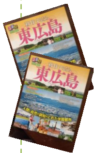
「るるぶ」特別編集 東広島

自治協運営・「役員の高齢化が進んでいて次の世代を担ってくれる人がいない」と、大方の自治協の悩み。それでも、会議の回数を少なくしては？などとアイデアも出るなど、自治協活動の運営にも前向きに取り組んでいます。また「人材育成のためワークショップの開催など、行政の協力が必要だ」などの意見も。 整合していないため敬老会の開催に支障がある」。それではどうすれば良いのか、一番良い方法は・・・などの話し合いも。 防犯・防災では「災害時に要援護者を救助する組織ができて機能するか難しい部分がある」など、それぞれ自治協で抱える問題点を話し合いました。 ある自治協議会では「まちづくりアンケート」を実施して住民の意識度を調査、今後の展開に生かすなど大いに成果を上げた地区もありました。 自治協の活動には市の協力が大いに必要で「まちづくりトーク」は各自治協の成功例を聞きながら、年々前向きな話し合いが行われているようです。