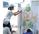
新キャラ「みつ丸くん」誕生!

※昨年末で「わくわく夕涼み会」として親まれてきた行事ですが、子どもたちにより親しみをもっていたきたいとの思いで、三ツ城小学校児童に新行事名と新ゆるキャラの名前「みつ丸くん」をつけていただきました。