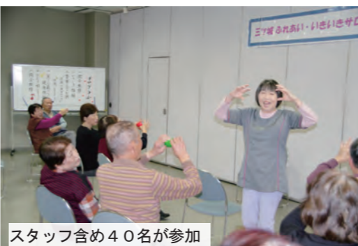
スタッフ含め40名が参加

先生に教えていただいたのは、椅子に座って誰もがができる運動で、ストレッチ、呼吸法、脳トレ、ボールを使ったユニークな体操など、盛りだくさんの内容で、終わるころには皆さん表情も一層明るくなったようです。