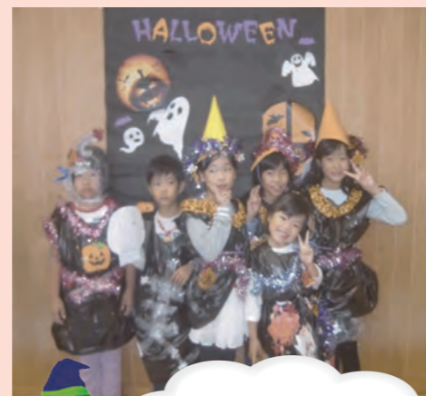
子どもたちの発想力にびっくり!

この日のために、子ども会役員30名の皆さんが何度も会議を重ねる行事を計画し、今年も中央中学校から12名の生徒と、地域から8名のスタッフが参加し、みんなで力を合わせて行いました。