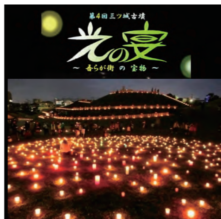
皆さま、ご協力ありがとうございました。

10月21(土)開催予定だった第4回三ツ城古墳「光の宴」は、大型台風のため、開催以来初の中止となりました。