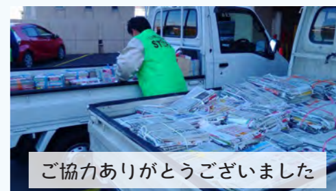
ご協力ありがとうございました

三ツ城小学校校内をお借りして廃品回収を行いました。地域の方々より持ち込まれた、新聞紙、雑誌、アルミ缶を2台の軽トラックに積み込み、リサイクル工場へと運び出しました。