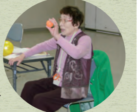
講演も大好評でした