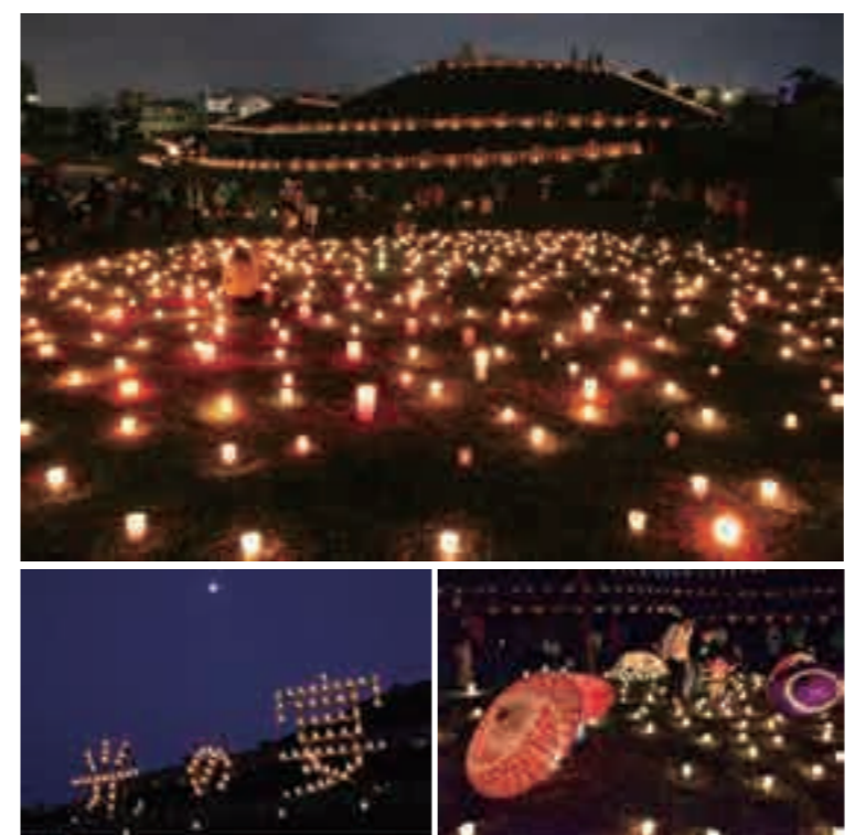
写真は平成28年三ツ城古墳公園で開催された「光の宴」より。今年は10月5日(土)の開催となります。