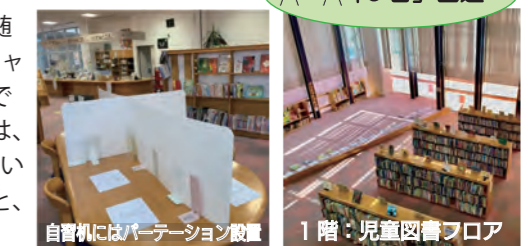
自習机にはパーテーション設置 1階：児童図書フロア

現在は感染防止策が随所に施され、全館ソーシャルディスタンス。裸足でくつろげる幼児エリアは、「読み聞かせなどふれあいの機会が減って残念」と、ボランティアさん。