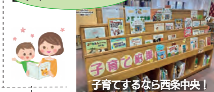
子育てするなら西条中央！

テーマや目的ごとに各所に設置された市民お役立ちコーナーや、期間限定の特設イベントコーナーも充実。各担当者の「本気度」が伝わるディスプレイ。利用者目線での優しい気配りもいっぱいです。