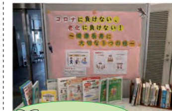
各種情報コーナー

5年ほど前に入口近くに自販機が設置されて以来、人気の「カフェコーナー」。ここ数年で、図書館はとっても居心地のいい空間に。入口では、「せせらぎビオトープ（人工水槽）」がお出迎え。