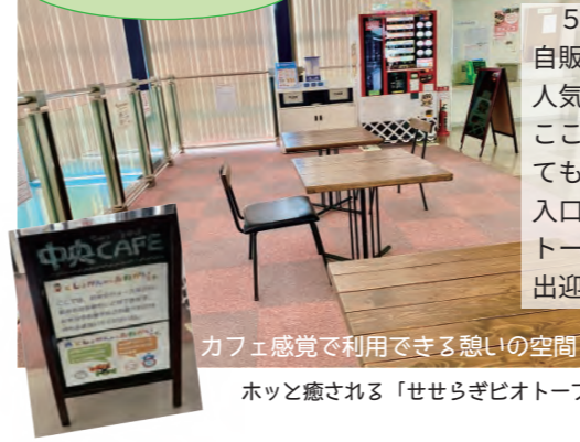
カフェ感覚で利用できる憩いの空間 ホッと癒される「せせらぎビオトープ」▶