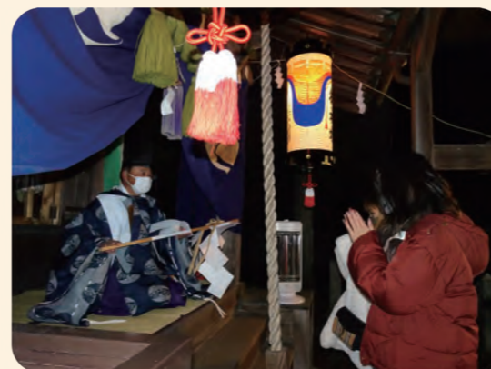
大晦日の歳旦祭で手をあわせる参拝客

令和2年年末の大晦日から新年にかけて、和泉八幡神社（西条中央6丁目）にて、「歳旦祭」が行われました。